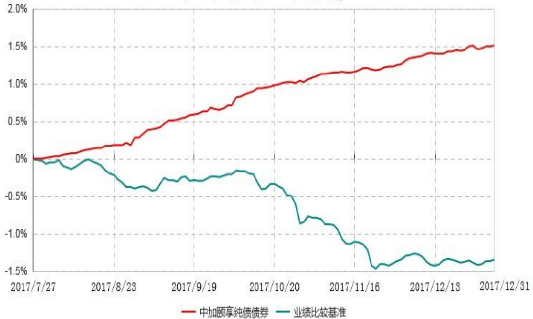
中加颐享纯债债券型证券投资基金累计净值增长率与业绩比较基准收益率历史走势对比图 (2017年07月27日-2017年12月31日)

注：1. 本基金基金合同于2017年7月27日生效，截至报告期末，本基金基金合同生效不满一年。