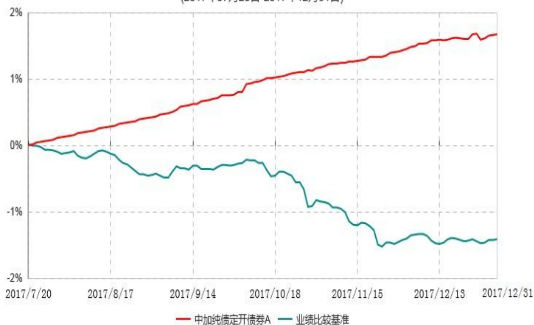
中加纯债定开债券A累计净值增长率与业绩比较基准收益率历史走势对比图 (2017年07月20日-2017年12月31日)