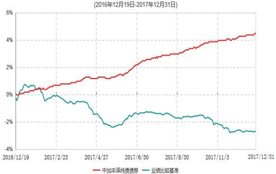
中加丰泽纯债债券型证券投资基金累计净值增长率与业绩比较基准收益率历史走势对比图

注：1. 本基金基金合同于2016年12月19日生效，截至报告期末，本基金基金合同生效已满一年。